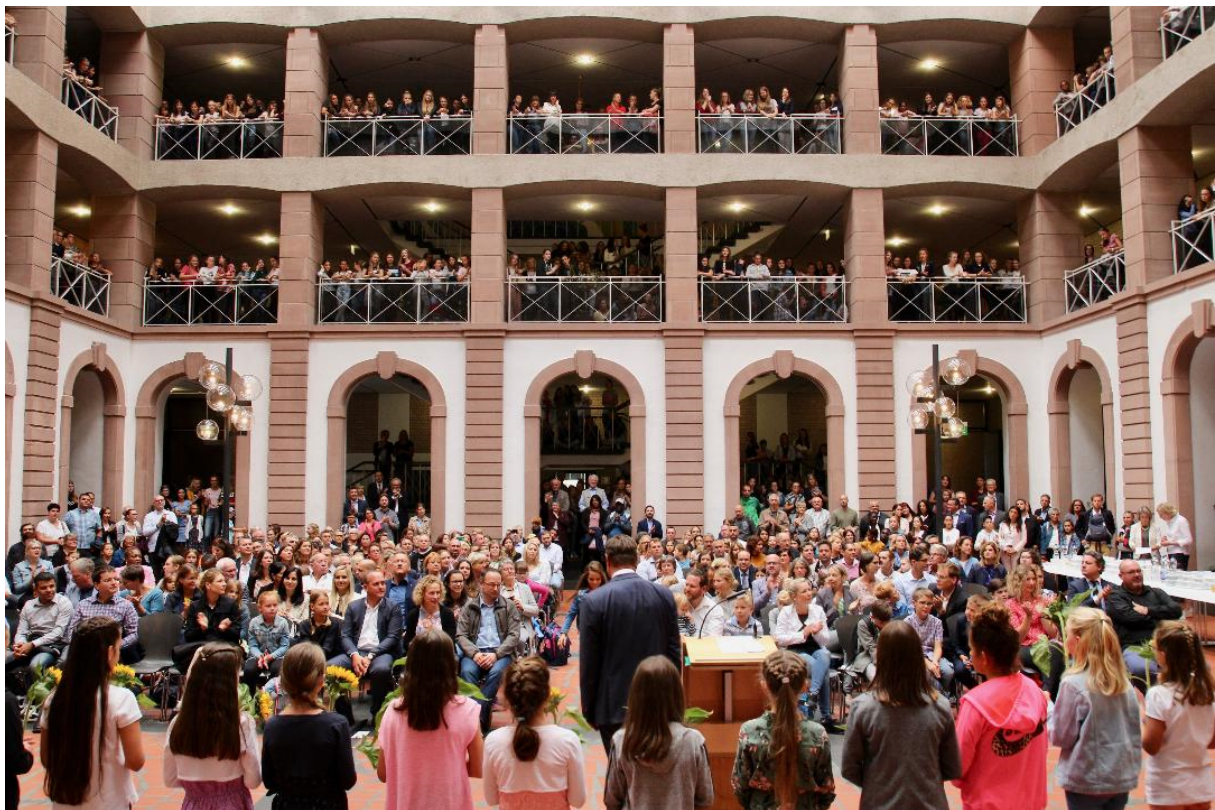
Feierliche Einschulung der neuen Schülerinnen und Schüler

Zu Beginn des neuen Schuljahres 2019/20 möchte ich Sie auf diesem Wege wieder über einige Neuigkeiten aus unserem Haus informieren.